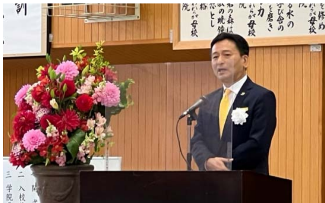
山口知事による激励の言葉