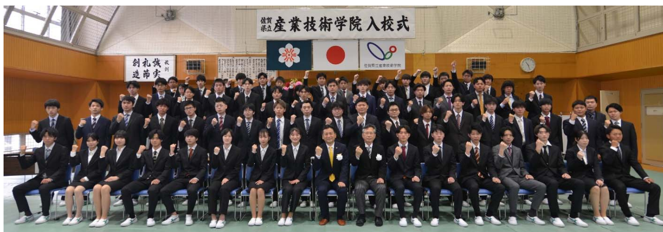
知事とともに記念撮影