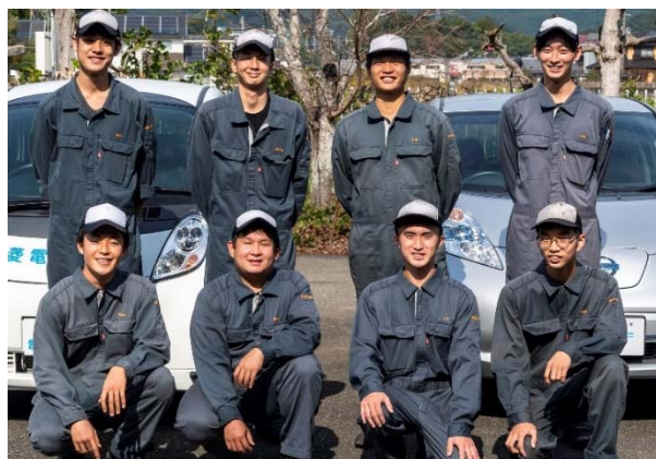
全員合格のR4年3月の修了生