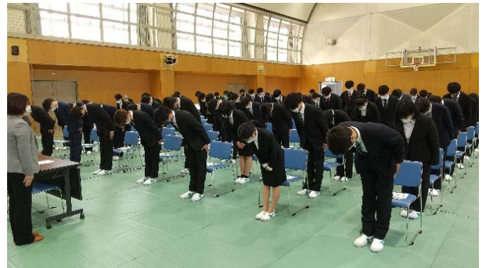
語先後礼の練習をする1年生

1年生68名のうち、45名はこの3月に高校を卒業したばかりで、社会人としての経験やスーツも着たことがない。この日は外部の講師から基本的な事項を指導していただいた。