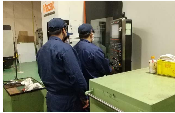
技能照査（機械技術科）