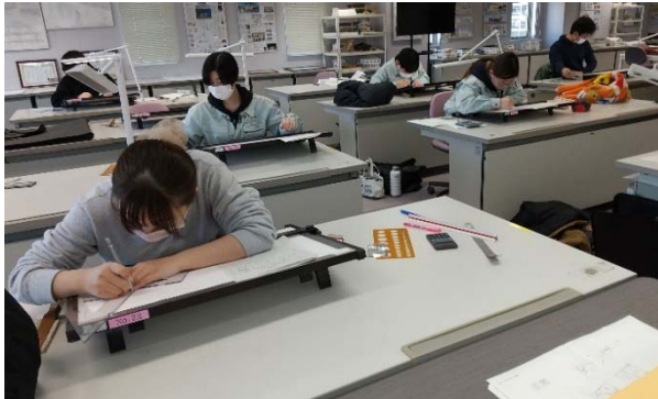
技能照査（建築技術・設計科）

学院では「技術・技能を磨き 社会人基礎力を高め プロフェッショナルを目指そう」のスローガンのもと、2年間にわたって各種の訓練を実施し、所定のレベルに達すると「修了」となる。この「所定のレベルに達したかどうか」を判定するものが「技能照査」である。学科及び実技の両方の試験に合格して晴れて「修了」となる。2月の初旬から技能照査が始まり今年度も全員が合格し修了を控えている。