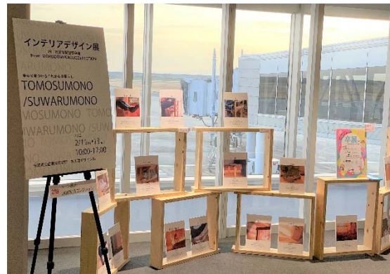
「インテリアデザイン展」：佐賀空港

空港の利用者だけでなく、わざわざこの展示を見に来た来場者も多かった。なお、同科では3/3(木)～3/5(木)アバンセにて「卒業制作展」を開催する。