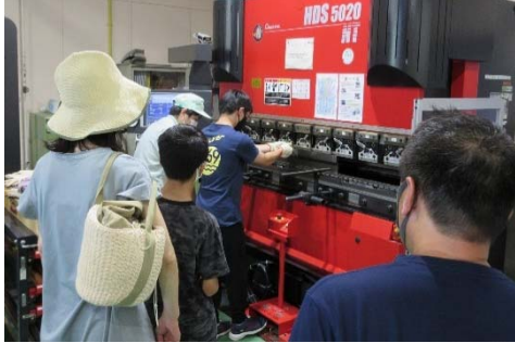
機械技術科「アイアンラック製作」