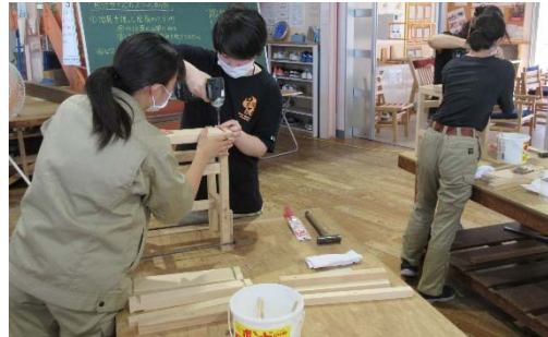
木工芸デザイン科「自分サイズの椅子製作」