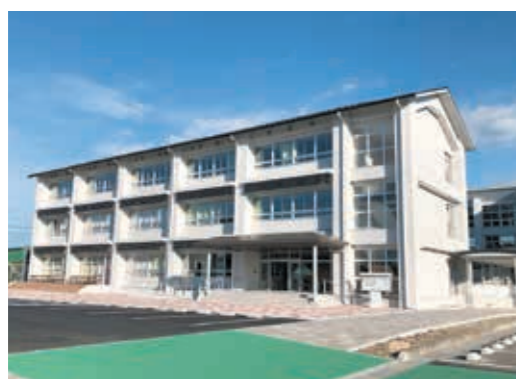
Matatagpuan sa gusali ng paaralan na pagsusulatan sa Saga Kita Haiskul