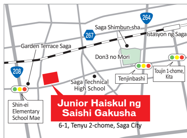
Humigit-kumulang 25 minutong lakad mula sa Istasyon ng Saga Humigit-kumulang 1 minutong lakad mula sa hintuan ng bus ng Kitakou-Maehe sa Bus ng Lunsod sa Saga.