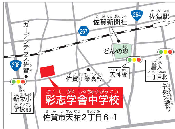
佐賀駅から徒歩約25分 佐賀市営バス「北高前」停留所から徒歩約1分