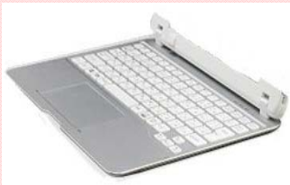
スリムキーボード