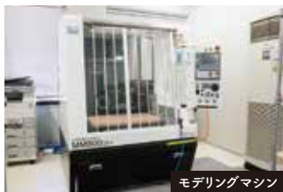
モデリングマシン

ろくろコースでは電動ろくろ、絵付コースでは作業机がひとり一台完備されています。 製造技術コースでは、石膏ろくろや3Dプリンターなど充実した設備でしっかり学べます。