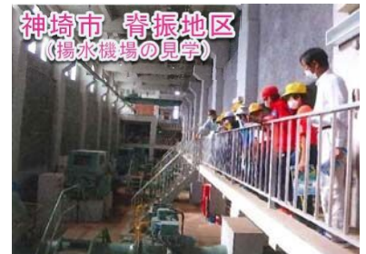
花、野菜の植栽体験、水生生物調査、揚水機場及び頭首工の見学等