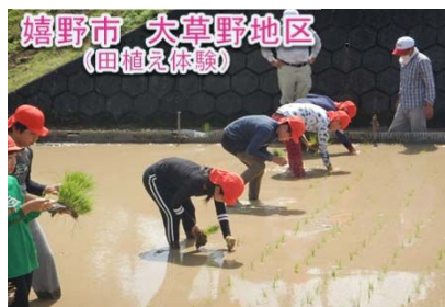
稲作体験、芋ほり、蛍の幼虫放流、大草野の水と農業の歴史講和等