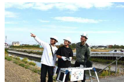
ドローン操作体験