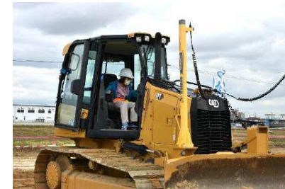
建設機械操作体験