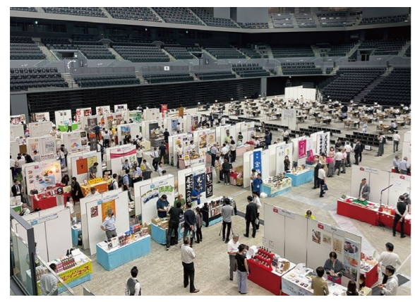
展示会・商談会の様子

SAGAアリーナは、スポーツやコンサートだけでなく、学会や業界団体の全国大会、展示会などのMICEも開催可能な多目的アリーナです。MICEは、スポーツ大会やコンサートと比べて、平日に開催されることが多く、開催期間も3日程度あることから、県内での宿泊や飲食、土産物の購入や観光などにつながることで、県内経済への波及効果が期待されています。SAGAアリーナの完成により、これまで佐賀では困難だった大規模なMICEの