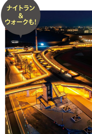
ライトアップされたSAGAサンライズパーク