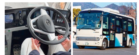
ハンドルが自動で動く! 最高速度40km/h