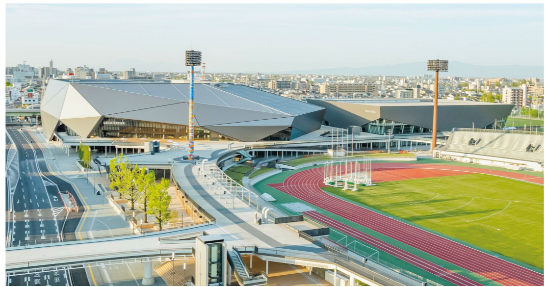
サンライズパーク全景

今年5月13日、SAGA2024、さらにその先の佐賀の未来を見据えて整備を進めてきた「SAGAサンライズパーク」がグランドオープンしました。 新時代のエンターテインメントアリーナ「SAGAアリーナ」やカフェ・ショップが入るくつろぎの空間「パークテラス」、3つのコースでランニングを楽しむ「ランニングループ」などが今回新たに加わり、日常からそれぞれのスタイルで楽しめる心地よい空間に生まれ変わりました。SAGAアリーナ1階から4階までの観客席は、最大勾配35度のすり鉢状で、どの観客席からも見やすく、