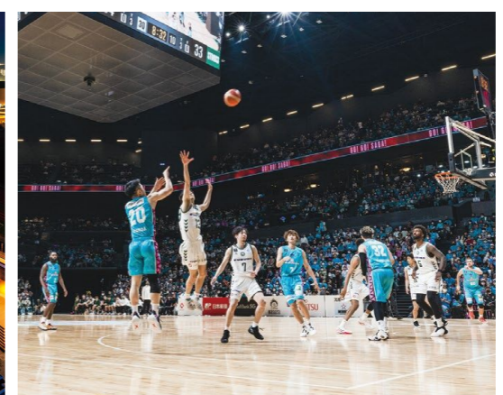
パルナーズがB1昇格を決めたプレーオフ

今までの日本にない熱狂的な雰囲気を感じることが出来ます。プロスポーツやコンサート、MICE(学会、展示会など)をはじめ、これまでの佐賀になかった様々なシーンを実現していきます。 夢や感動がうまれるSAGAアリーナを核に、新たな価値を発信するSAGAサンライズパークのこれからの、ぜひご期待ください。