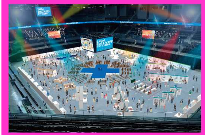
メインアリーナのイメージ