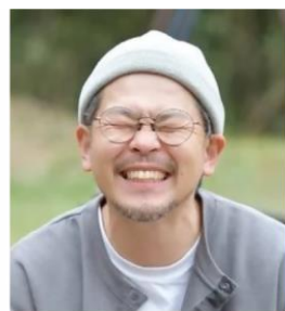
おもしろそうから始める。 自分地域活性化ディレクター