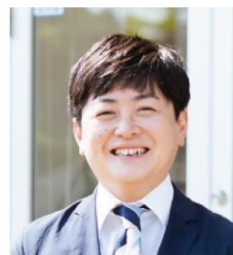
地域の魅力を編集する 老舗印刷屋