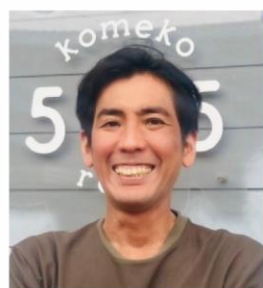
飲食ビジネスの スペシャリスト