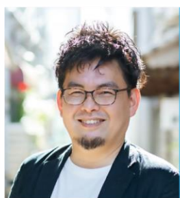
地域の魅力を発信する ウェブプランナー