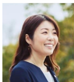
かわりで離島を リジェネイトする社会起業家