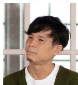
古民家からエリアを 変える仕掛け人