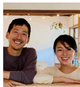
豊かな自然をおいしく伝える クリエイティブファーマー