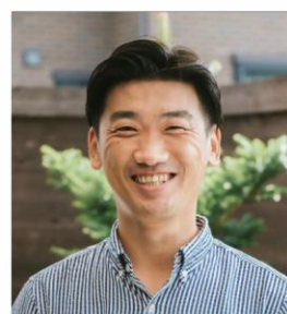
業種不同の アントレプレナー