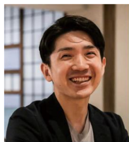
音楽と地域を愛する 老舗旅館15代目