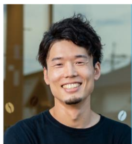
経営センス抜群の カフェオーナー