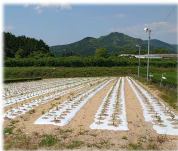
輸出対応のための生葉の集約加工