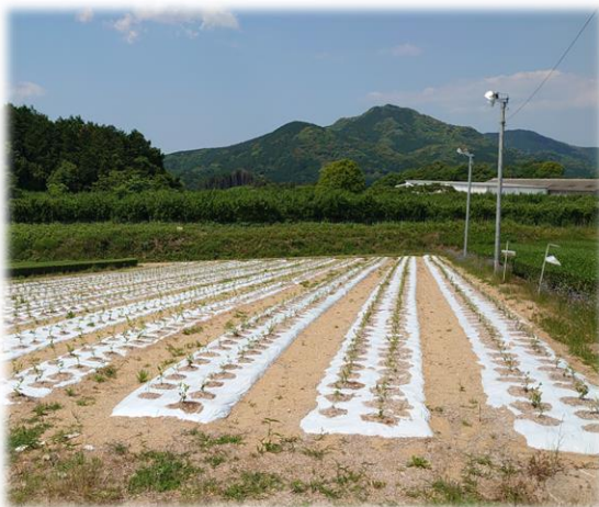
輸出対応のための生葉の集約加工