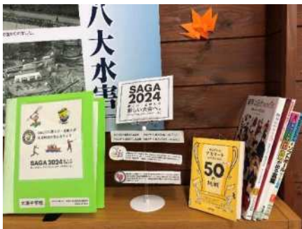
2024 国体スポーツコーナー