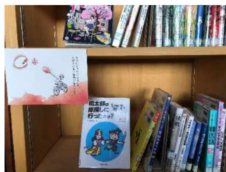
パレットリーディング