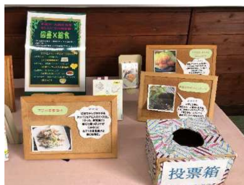
学校給食とのコラボ