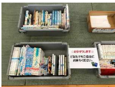
廃棄本のおゆずり