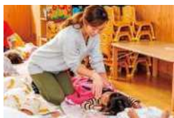
定期的に呼吸の確認をします