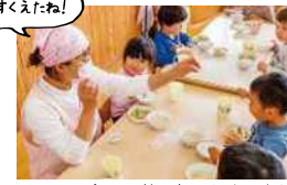
スプーンの持ち方なども伝えます