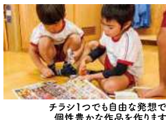
チラシ1つでも自由な発想で個性豊かな作品を作ります

これまでの経験から、自由に工夫して表現できるようになります。また、友達とルールを守り、協力しながら遊ぶこともできます。