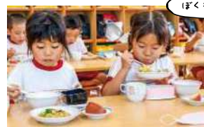
5歳児クラスの食事の様子

今日のメニューは、タンドリーチキン、クリームシチュー、サラダ、りんごです。3歳児はスプーンやフォークを使って、5歳児は箸を使って食べる子が多くなります。友達の「おいしい!」の声を聞いて苦手な野菜にチャレンジする子や、普段しないおかわりをする子もいます。