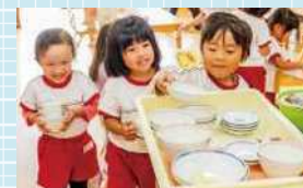
食器の片づけも習慣になります

幼児は、健康的な生活を送るために必要な基本的な生活習慣や態度を、日常生活の中で身につけます。園でも、一人ひとりの発達に合わせて、幼児が「やりたい!」と思えるように工夫しながら支援しています。例えば手洗いの場合、まずは興味をもってもらうために、手洗いの大切さを絵本などで伝えます。そして、歌などで楽しく手洗いの手順を覚え、食事前やトイレの後に声をかけて、手洗いを習慣にしていきます。