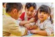
指先を使うパズル遊び

2歳児は体や心、脳の成長が著しく、指先や全身を動かすことが重要です。身のまわりのものを何かに見立てて楽しむ姿も見られます。個人差が大きいので、一人ひとりに合わせた素材やおもちゃを準備します。