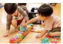
ブロックを車に見立てた遊び