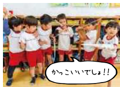
「かっこいいでしょ!!」