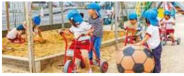
三輪車やボール、砂場など好きなもので遊びます