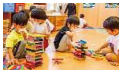
少人数での積み木遊び