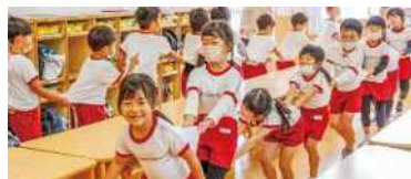
じゃんけん列車などルールのある遊びもします