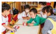
保育者がルールを伝えながら遊びます