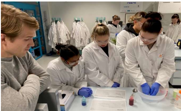
ヘルシンキ大学の実験室で、 スーパーボールを作る幼稚園の先生たち

県立大学においても、県立・市町立・私立の小中学校との連携を強化することで、佐賀県の子供たちが、学びの意味や大学に対するイメージを早い段階で理解し、成長をアシストしていきます。