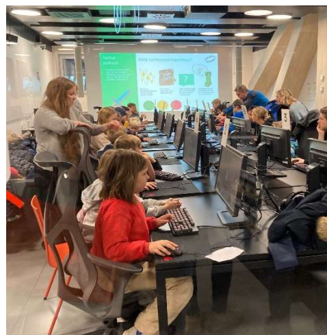
ヘルシンキ中央図書館における アールト大学が支援する プログラミングの講座風景