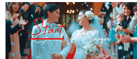
佐賀で暮らす、すべての人々の幸せを応援する 動画「Start in Saga」(YouTube)

県内外に広く発信し、「佐賀で子育てしたい！」と、たくさんの方に思ってもらえるように取り組んでいきます。