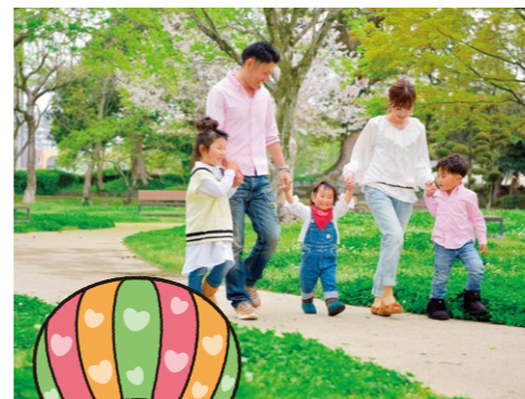
佐賀県子育て 応援キャラクター さがっぴい

また、これまで積み重ねてきた佐賀ならではの子育て支援や、魅力ある佐賀の子育て環境を、さまざまな場面を通じて