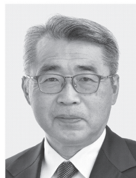
宮崎 まさる 現1 前環境大臣政務官。党環境部会長。埼玉大学工学部卒。64歳。