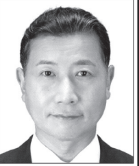
たるい 良和 元衆議院議員 表現の自由を守る・日本V字回復やっつらい