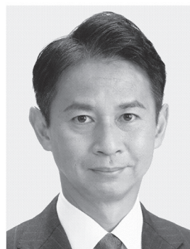
谷 あい 正明 現3 元農林水産副大臣、党参議院幹事長。京都大学大学院修士課程修了。49歳。