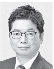
石橋 みちひろ 参議院議員 現・57