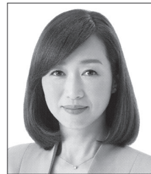
党首 積量子 しやくりょうこ