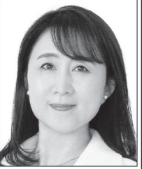
矢田 わか子 国民民主党 副代表 あなたと動けば、未来は変わる。