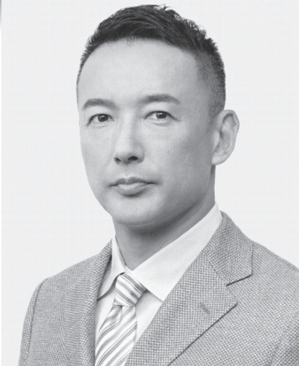
れいわ新選組 代表