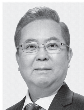
よこやま 信一 現2 前復興副大臣。北海道大学大学院博士課程単位取得。水産学博士。62歳。

公明党はこの7人をはじめ参院選比例区に17人を公認しています。 ※年齢は選挙期日現在