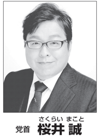
さくらい まこと 党首 桜井 誠