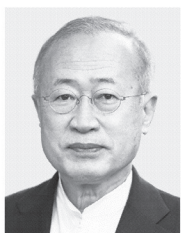
有田 芳生 参議院議員 現・70