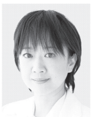
青木 愛 参議院議員 現・56