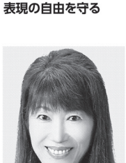
はたともし 元参議院議員 心を燃やせ!カシ/阻止。 ワクチンより検査!