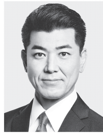
立憲民主党 代表 泉 健太