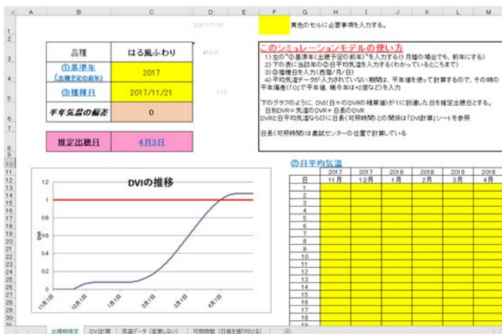
図1 Excelを使った「はる風ふわり」の出穂期推定プログラムの入力画面。