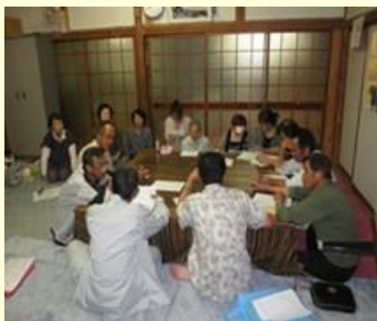
棚田イベントの開催