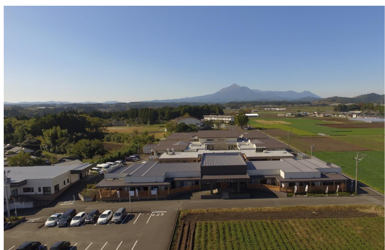
運営施設の1つ「特別養護老人ホームほほえみの園」の全景（バックは霧島山）