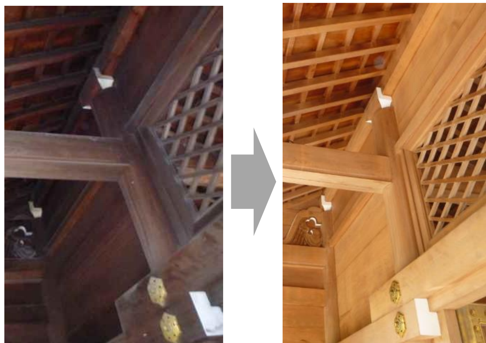
伝統手法である「木部灰汁洗い」 木を削ることなく建てた当初の風合いや木の香りを よみがえらせます。