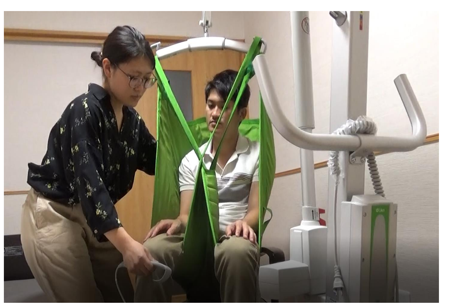
最新の福祉用具（リフト）の導入により 抱えない介護を実現