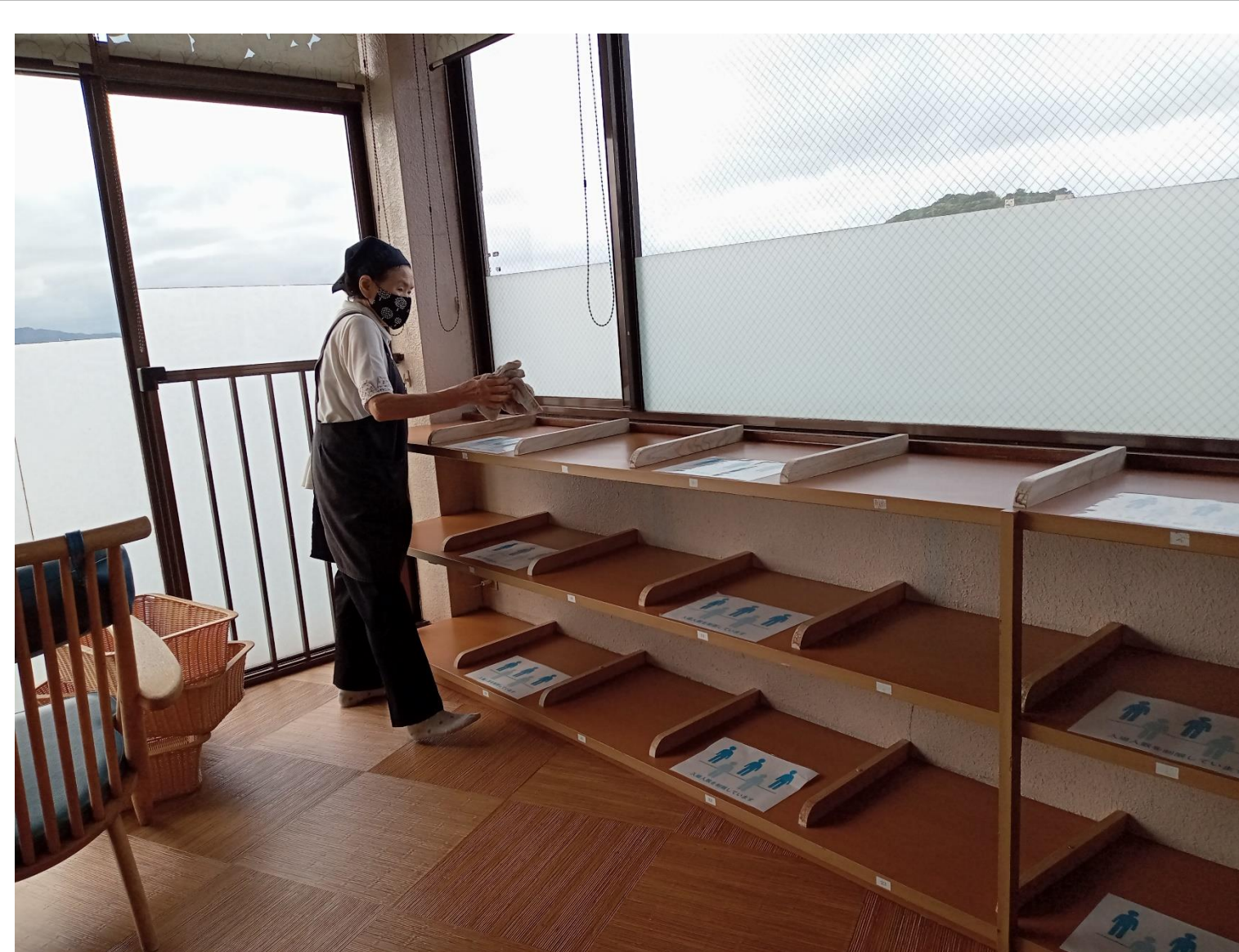
大浴場脱衣場の清掃作業の様子