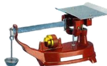
5. 不等比皿手動はかり