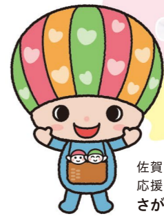
佐賀県子育て 応援キャラクター さがっぴい