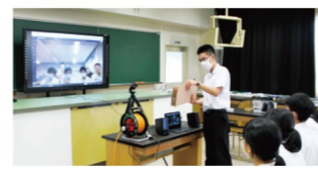
生徒交流の実例紹介

県教育委員会では、平成23(2011)年度から全国に先駆けて全県規模でICT活用教育に取り組み、平成26(2014)年度からは、全ての県立学校に1人1台端末を導入し、授業や様々な教育活動でICTの活用に取り組んできました。