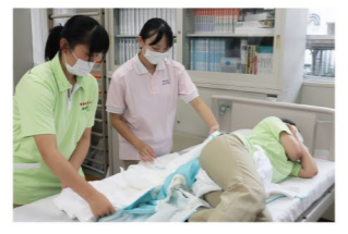
生徒の実習の様子(介護関係)