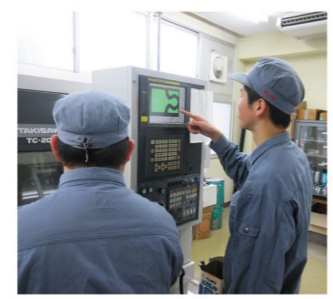
生徒の実習の様子(工業関係)