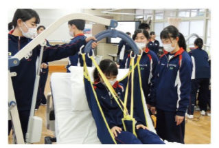
生徒の実習の様子(介護関係)

新型コロナウイルス感染症の影響により、製造業や介護分野などでの人手不足が続いています。こうした状況に対応すべく、県立の専門学科・総合学科高校では地元企業に求められる最先端技術を身に付けた若手技術者や介護人材などの育成に一層力を入れているところです。 県では、今年度、各県立の専門学科・総合学科高校において、最先端のデジタル