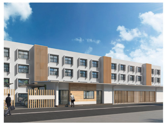
佐賀市のアスリート寮の完成イメージ図

2024年に本県で開催される「SAGA2024」を契機に、SAGAサンライズパークの整備を進めています。 この秋、いよいよ水泳場「SAGAアクア」がオープンします。メインとなる屋内50mプールは、競泳、水球など、用途に応じて水深を調整でき、約1,200席の観客席や大型ビジョンを備え、国際大会の開催も可能です。飛込プールもリニューアル! また、2023年春のグラントオープンに向けて、約8,400席の九州最大級の多目的アリーナとなる「SAGAアリーナ」などの建設工事も進めています。