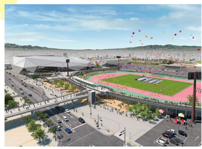
SAGAサンライズパーク完成イメージ

2024年に本県で開催される「SAGA2024」を契機に、SAGAサンライズパークの整備を進めています。 この秋、いよいよ水泳場「SAGAアクア」がオープンします。メインとなる屋内50mプールは、競泳、水球など、用途に応じて水深を調整でき、約1,200席の観客席や大型ビジョンを備え、国際大会の開催も可能です。飛込プールもリニューアル! また、2023年春のグラントオープンに向けて、約8,400席の九州最大級の多目的アリーナとなる「SAGAアリーナ」などの建設工事も進めています。