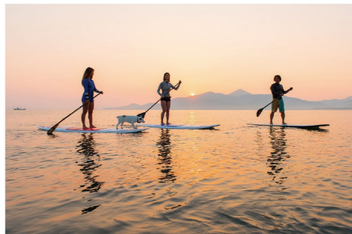
唐津の海でSUP(サップ)*を楽しむ様子

県では、新型コロナウイルス感染症の感染リスクを最小限に抑えながら、広い空のもとで佐賀の魅力を感じていただく「OPEN・AIR佐賀」を展開しており、豊かな自然の中でスポーツを楽しむアウトドアアクティビティの創出を進めています。 年齢や性別を問わず、体力に応じて誰もが気軽に楽しめる環境づくりに向けて、