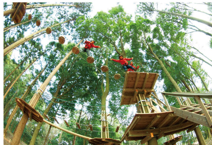
フォレストアドベンチャー・吉野ヶ里

民間事業者などと連携しながら、体験メニューを充実し、受入体制を強化します。また、利用を促進するため、情報発信や体験の機会づくりにも力を入れていきます。 これからの時代にマッチした新たなライフスタイルとして、地域の魅力向上や交流人口の拡大につなげていきます。 *SUP/スタンドアップパドルボード。ハワイ発祥のマリンスポーツでサーフボードより少し大きめのボードの上に立ち、波乗りや海の上を散歩することができます。