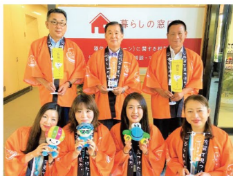
さが移住サポートデスク相談員