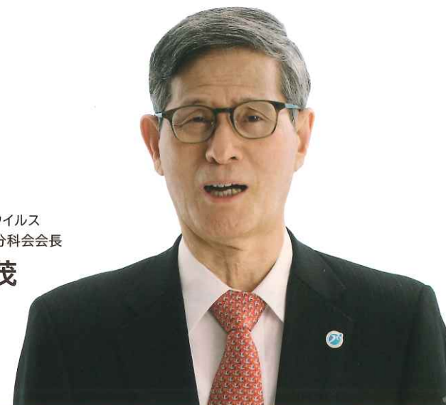
新型コロナウイルス 感染症対策分科会会長