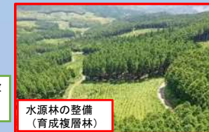
水源林の整備 (育成復層林)