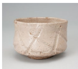
かいゆうほりもん ちゃわん めい げんかい 灰釉彫文茶碗 銘「玄海」 佐賀県重要文化財 肥前 1580～1600年代

九州陶磁文化館では、開館40周年記念・寄贈記念 特別企画展『高取家コレクション』と『柴澤コレクション』を開催します。