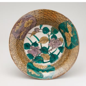
いろえつばきはすもん おおざら 色絵椿蓮文大皿 肥前 有田 1650年代

本展覧会では、これまでの発掘調査を総括し、江戸時代の建物の位置や間取りを原寸大で現地に平面表示するとともに、出土遺物やグラフィック展示を連動させ、佐賀城本丸御殿を現代によみがえらせます。