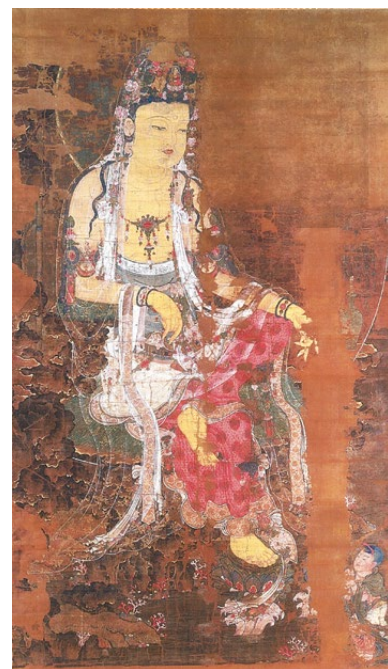
『楊柳観音像』高麗時代(13世紀) 唐津市鏡神社蔵 重要文化財

今回の特別展では、有明海と玄界灘の2つの海がつかないだ佐賀と世界の交流の歴史、そして今に受けつがれる先人たちの進取と創造の精神とその志を紹介いたします。当館の学芸員がおすすめる佐賀の逸品を一室に展示します。ぜひお楽しみください。