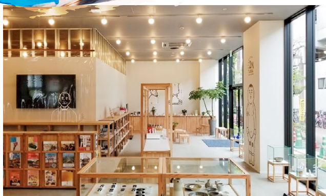
※コムボックス佐賀駅前：佐賀駅前にある商業施設