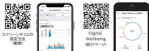
スクリーンタイムの設定方法(動画)

デジタルウェルビーイング Digital Wellbeing (Android10以上)