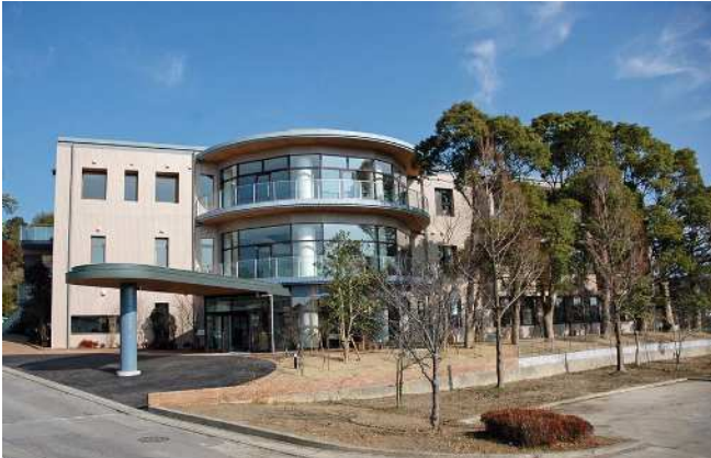
総合看護学科校舎