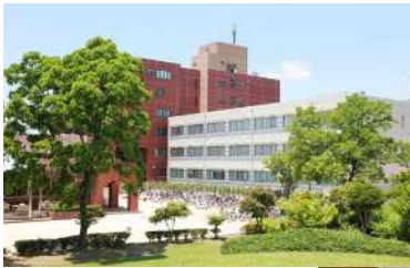
看護学科棟・講義棟