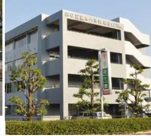
専攻看護学科校舎