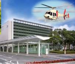
実習病院：佐賀大学医学部附属病院