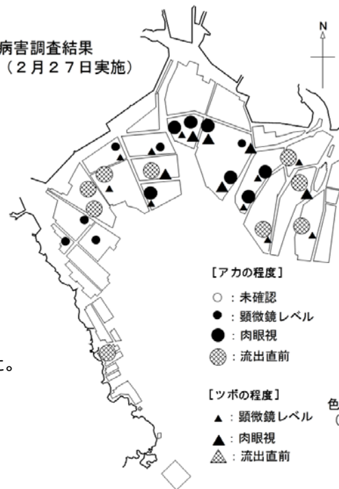
病害調査結果 （2月27日実施）