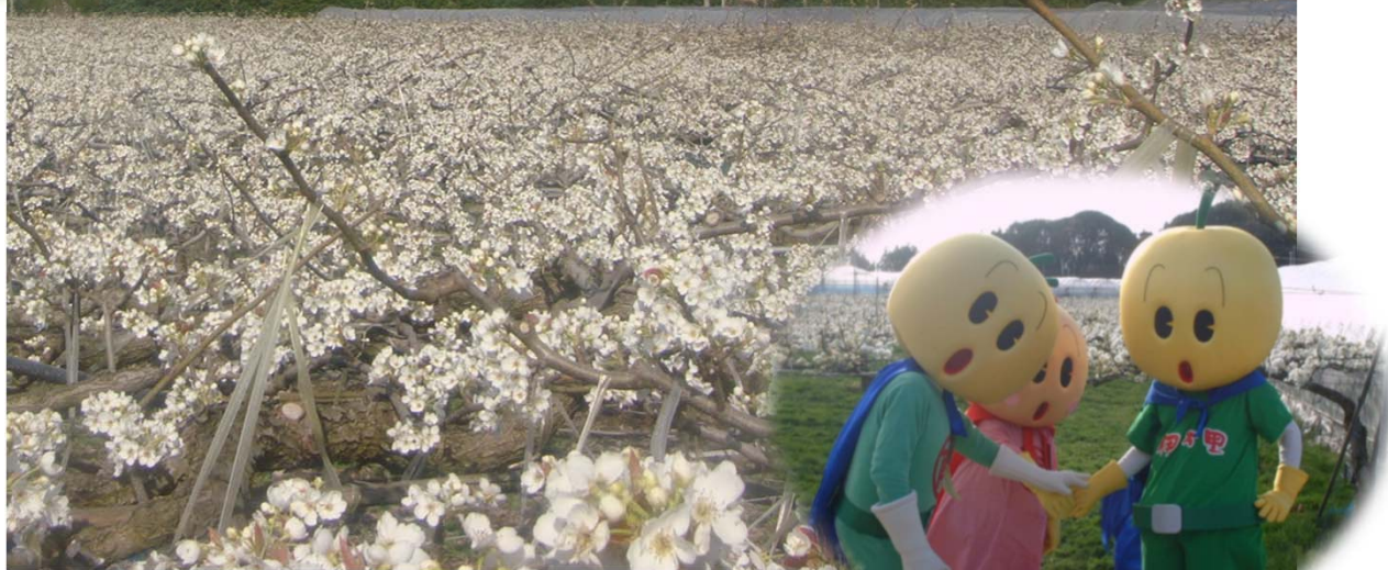
伊万里梨キャラクター (左から) なし万里くん、梨里ちゃん、万梨之助くん