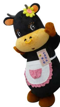
伊万里市マスコットキャラクター 『いまりんもーちゃん』