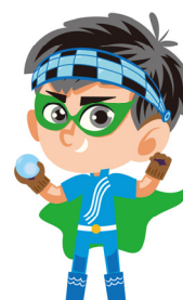
森川海人プロジェクトキャラクター もりかわいと 森川海人くん