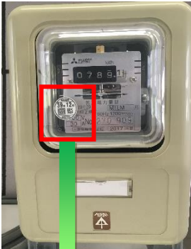
電気メーター (有効期限 5, 7, 10 年)