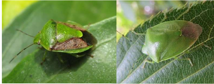
チャバネアオカメムシ（左）とツヤアオカメムシ（右）

については、今後の果樹カメムシ類の動向に注意し、果樹園への飛来が確認された場合は、下記事項を参考に早急に防除対策を徹底するよう生産者への指導をお願いします。