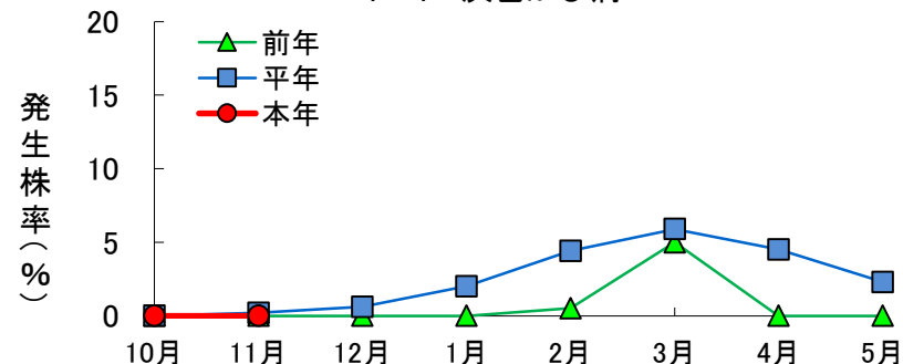
トマト 灰色かび病