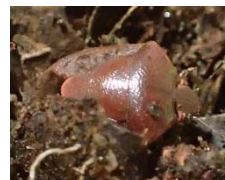
越冬中のチャバネ アオカメムシ

県内の山林でのチャバネアオカメムシの越冬量は平年より多く、さらに、向こう3か月の気温は平年に比べ高いと予想されているため、 本年4月～8月上旬のチャバネアオカメムシの果樹園への飛来は平年より多く、早いと予想されます。