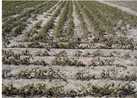
▲ 塩害により枯死した大豆