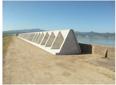
▲波返工の整備状況