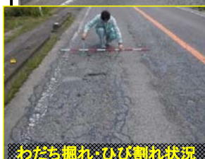
わだち掘れ、ひび割れ状況