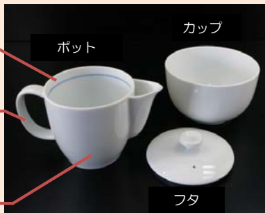
開発した紅茶審査器具

ポットは、茶殻の評価と器具洗浄をしやすいよう内面の底面部分をなめらかな曲線にし、また高台を広くして安定性を高めている。