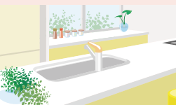
水周りリフォーム