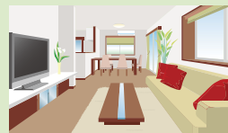
広々リビングリフォーム

「子供部屋用に間取りを変えたい」 「夫婦2人の広々リビング」 ライフステージの変化に合わせて必要な間取りへと変更することで快適な居住空間が生まれます。