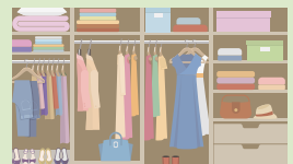
収納たっぷりリフォーム