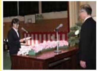
ちょっぴり緊張の入学宣誓