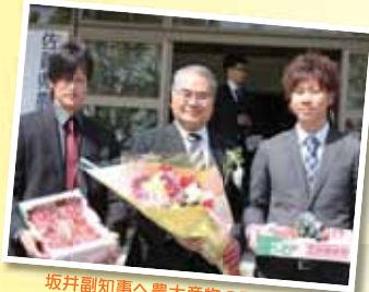
坂井副知事へ農大産物のアピール