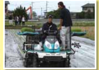
2年生が1年生に田植え指導中