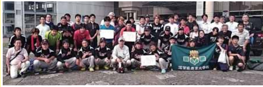
大分県での近県スポーツ大会 来年は、佐賀開催だ！