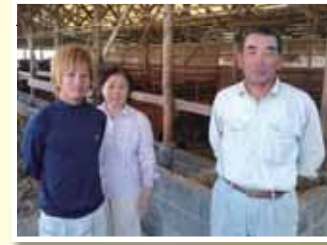
先進農家派遣 お世話になってます