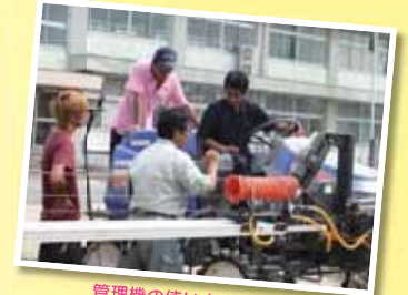
管理機の使い方の特訓中