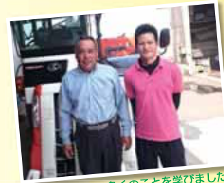
先進農家派遣 多くのことを学びました