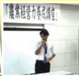
九州各県の農大生が集まる 「農業経営力養成講座」にて 卒業後の経営ビジョンを発表