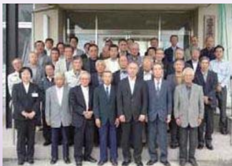
溝口校長と螢雪会各支部総代の皆さん