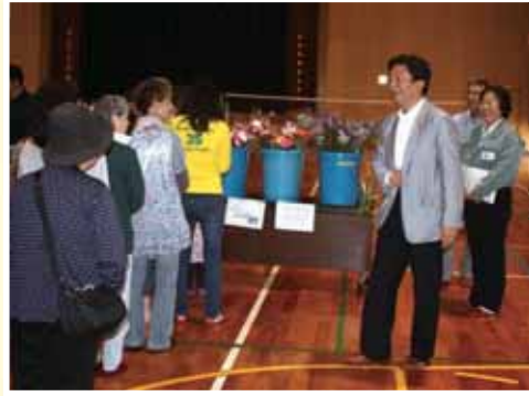
山口知事 農大直売で学生を激励 お客様に「評判はいかがですか？」