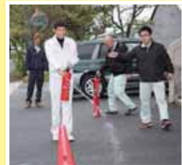
ここは真剣に防火訓練