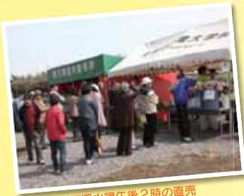
毎週水曜午後2時の直売