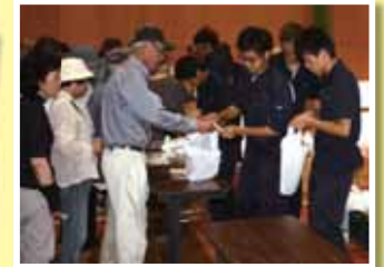
雨の日は体育館で直売を行います 1年生の接客も板についてきたかな