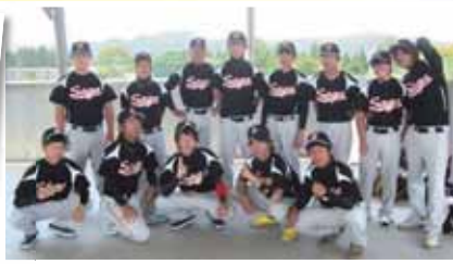
野球部のユニフォームを新調しました 成績は.....(相手強すぎでした)