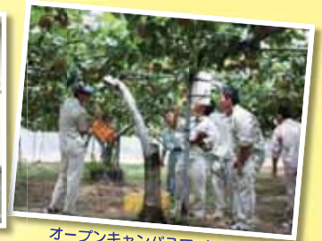
オープンキャンパスで、未来の 農大生が目を見ながら実習体験 (8月7・23日開催)