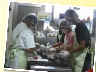
スモモのフルーツソース製造中