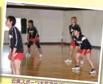
近県スポーツ大会でのバレーボール 1年生も健闘しました