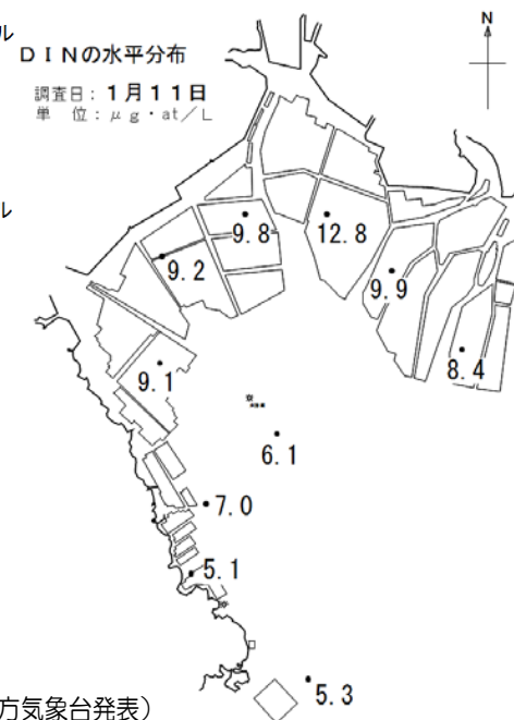
DINの水平分布 調査日：1月11日 単位： \mu\text{g}\cdot\text{at}/\text{L}