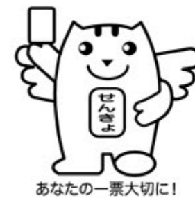
あなたの一票大切に!