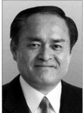
社民党党首 吉田 忠智