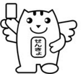
あなたの一票大切に!