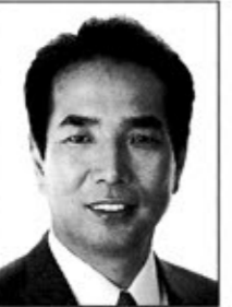
宮崎2区 江藤 拓