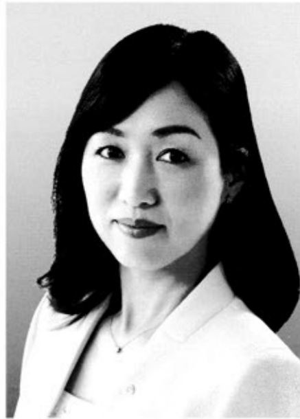
党首 積 量子