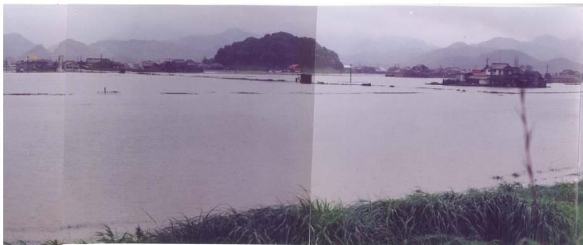
平成２年７月洪水 鹿島市森 塩田川右岸