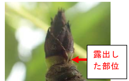
写真1 鱗片生組織が露出した芽

本病菌が感染した芽基部の鱗片は、翌年の伝染源となる。秋期の薬剤散布は翌年の黒星病の発病抑制に有効である(2013年熊本県農業研究センター果樹研究所、図1参照)。そのため、鱗片生組織(写真1)が露出し、本病に感染しやすくなる10月~11月中旬にデランフロアブル、オーソサイド水和剤80等を2~3回散布する