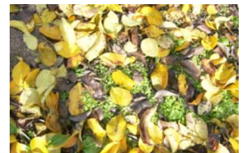
写真2 翌年の伝染源となる ナシの落葉

園内に放置された落葉(写真2)は、本病の翌年の伝染源となるので、土中にすき込むか、落葉を集め、園外で処分する。