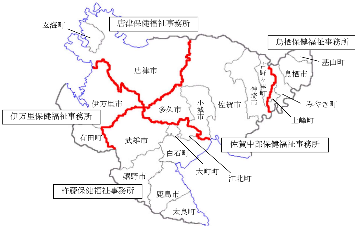
伊万里保健福祉事務所管内人口主要指標 (R7.10.1) ※出典「さが統計情報館 推計人口」