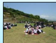
中高合同の歌垣山遠足