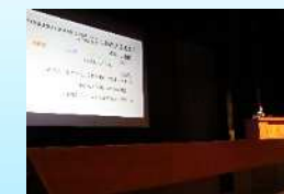
中高合同探究発表会